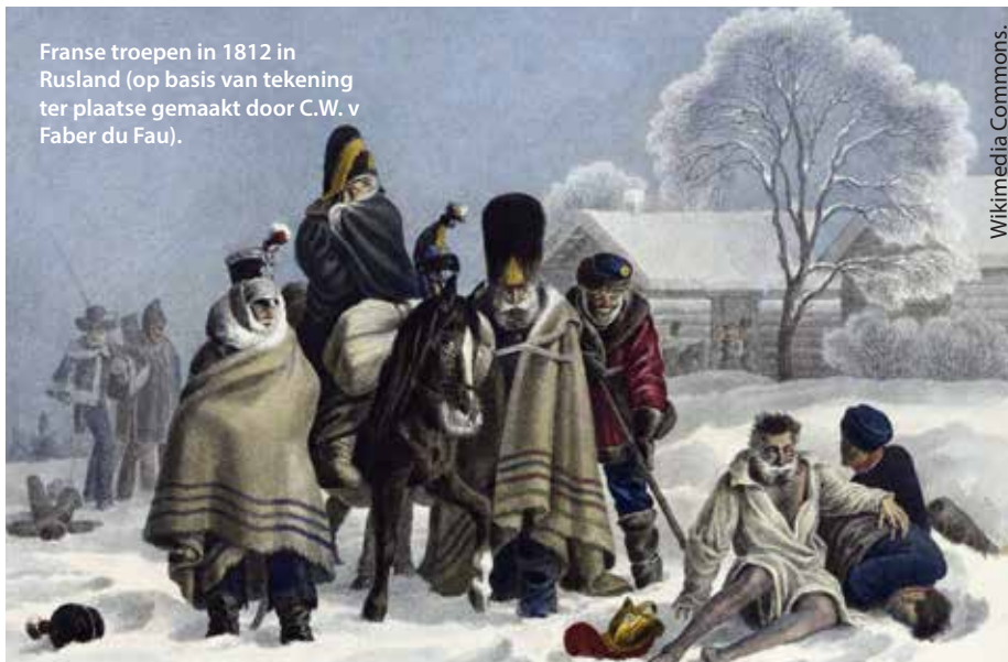
Fransen troepen in 1812 in Rusland (op basis van tekening ter plaatse gemaakt door C.W. v. Faber du Fau).

Meer feitelijke informatie, beeldend opge-diend, is te vinden in Het rijk van Napoleon in Infographics (Park Uitgevers, 2023).