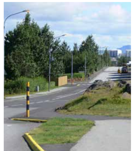
'Elfenrots' veroorzaakte straatomlegging in Kópavogur (foto Christian Bickel via Wikimedia Commons).