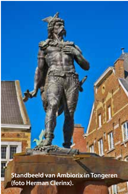
Standbeeld van Ambiorix in Tongeren.