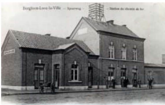
Station van Borgloon

consumenten in de steden en de markten in Engeland en Duitsland alsook kalksteen uit de mergelgrotten bij Wezet. Voor de aanleg van de verbinding Tienen – Wezet dienden private investeerders verschillende concessies in. Enkel het traject dat Drieslinter met Tongeren verbond, spoorlijn 23, werd in 1875 aan de Banque de Belgique vergund. De opdracht voorzag in de aanleg van de spoorweg en de bouw van de stations. De oplevering moest binnen de drie jaren gebeuren. Voor het gedeelte Neerlinter – Sint-Truiden lukte dat. Het traject werd op 27 mei 1878 ingereden. Door de strenge winter van 1878-1879 hadden de werken ernstige vertraging opgelopen. Ten gevolge van het heuvelachtige landschap moest de spoorweg afwisselend op een dijk worden aangelegd of in het landschap worden ingesneden. In de provincieraad werd in juli 1879 nog sterk aangedrongen op een spoedige afwerking van lijn 23. Goed twee maanden later, op 10 september 1879, werd ook de spoorlijn tussen Sint-Truiden en Tongeren voor reizigers opengesteld en vijf dagen later voor goederenvervoer. De spoorlijn was enkelsporig aangelegd en werd nooit geëlektrificeerd. De constructie van de stationsgebouwen in Zoutleeuw (1878), Ordingen (1879), Borgloon (1879) en Piringen (1879) maakte deel uit van de opdracht. Ze zijn allen van het zogenaamde type 'Banque de Belgique' dat men ook aantreft op andere spoorlijnen die door deze maatschappij werden aangelegd.