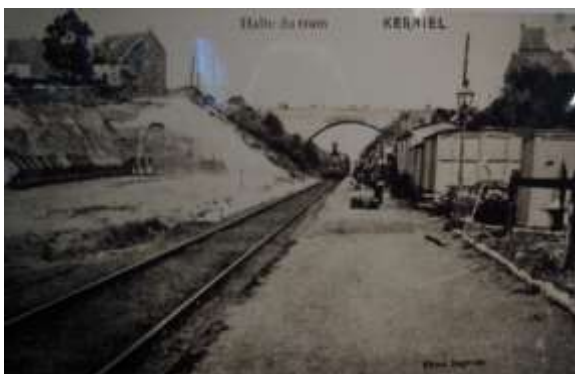
Brug over het Fruitspoor in Kerniel