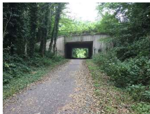
Brug over het Fruitspoor in Kerniel nu