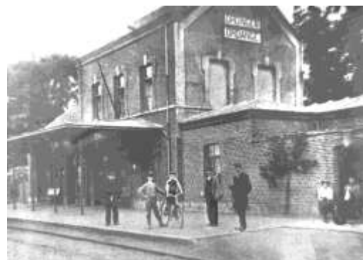
Station van Ordingen