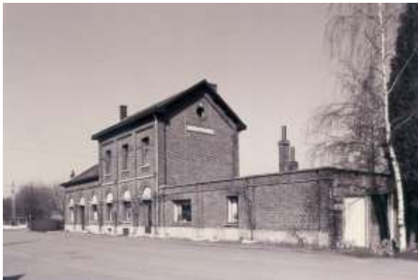
Station van Jesseren met goederenstation

Het toenemende vervoer leidde tussen 1893 en 1912 tot een uitbreiding van stopplaatsen en halteplaatsen die door de staatsspoorwegen met een klein station werden uitgerust. Dit was het geval in Wilderen (1895), Molveren (1899), Hoepertingen (1908) en Kerniel (1895). In Jesseren, Kerniel en Hoepertingen transformeerden die halteplaatsen zich onder invloed van de daar aanwezige stroopfabrieken uit tot volwaardige stations, Jesseren waar de Grande Siroperie Limbourgeoise was gevestigd, reeds in 1897, Kerniel en Hoepertingen respectievelijk in 1906 en 1908. Bovendien speelde het Fruitspoor ook een rol in de weerscommunicatie. In de jaren 1904-1905 heeft men getracht een soort 'waarschuwingsdienst' uit te bouwen die de boeren en fruittelers moesten verwittigen van veranderende weersomstandigheden. Via de telegraaf werden de weersvoorzichten aan de stations en postkantoren doorgeseind. Schoolkinderen moesten van daaruit de landbouwers verwittigen. Boven op het station van Borgloon was daartoe een telegraaf geplaatst. Het resultaat bleek echter nogal teleurstellend.