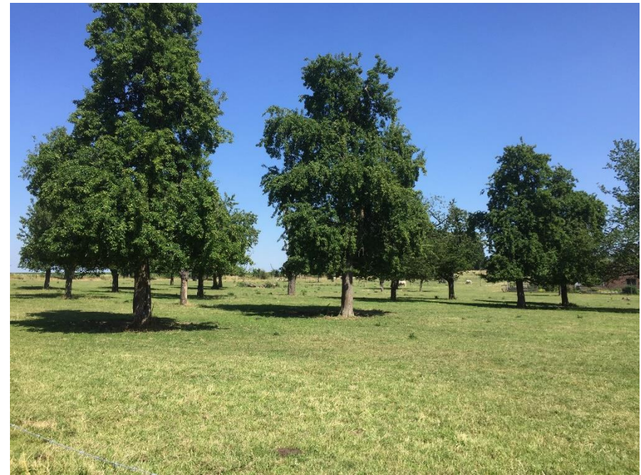
Hoogstamboomgaard tegenover het kasteel van Heers

Het aantal fruit- en boomkwekers nam constant toe. Sint-Truiden, Borgloon en Tongeren werden de fruitcentra van Haspengouw. Zelfs binnen de fruitregio ontwikkelde zich een zekere specialisatie, onder