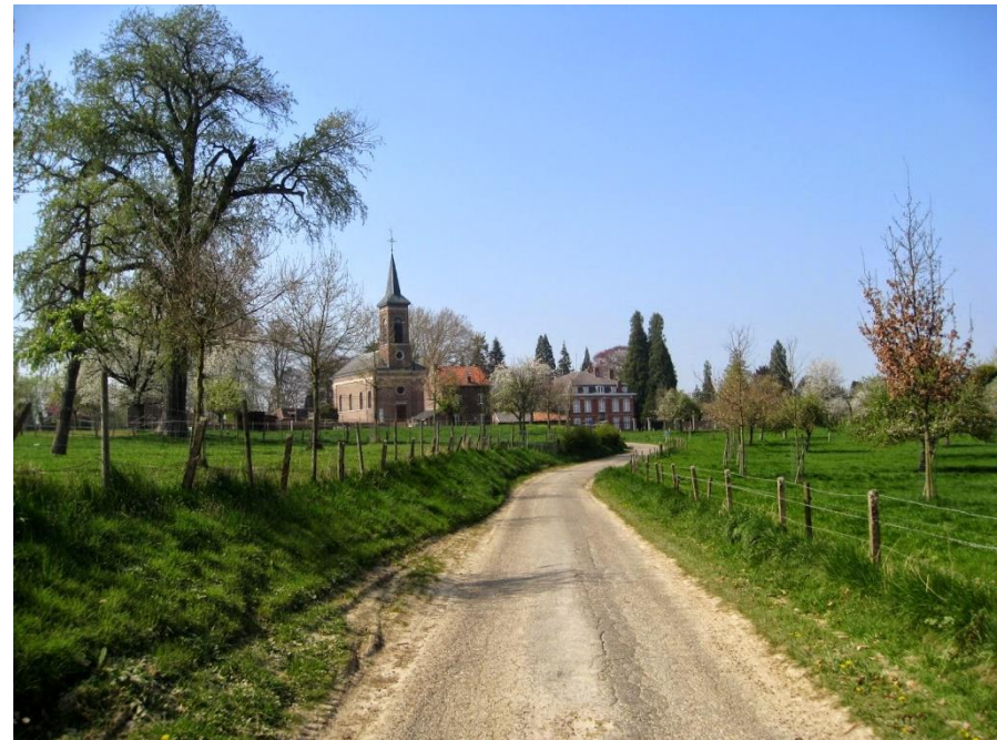
Bommershoven op het einde van een verharde oude veldweg

Deze vier ingrepen hebben het landschap tussen de drie steden ingrijpend bepaald. Haspengouw bezit weliswaar nog natuur, maar heeft zich feitelijk van een natuurlandschap tot een cultuurlandschap ontwikkeld waarin de aanwezige landschapselementen en historische erfgoedrelicten die ontwikkeling illustreren.