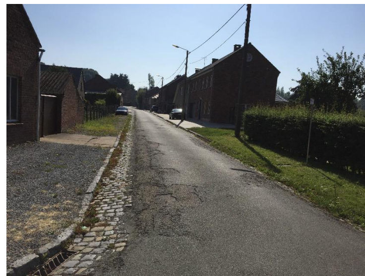
De Romeinse weg in Tongeren en Bommershoven