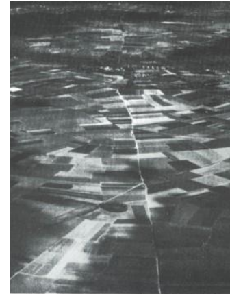
rs. 6. De romaanse baan Trier-Tongeren; op de voorgrond, de tumulus van Brustem

In talrijke Haspengouwse dorpen hebben de archeologen resten van Gallo-Romeinse landbouwbedrijven terug gevonden, gelijkmatig gespreid en vaak vergezeld van tumuli waarvan de site van de villa van Broekom met de tumulus van Gutschoven evenals de tumulus van Brustem getuigen.