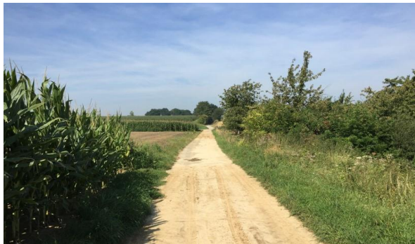
De Romeinse weg tussen Tongeren en Sint-Truiden