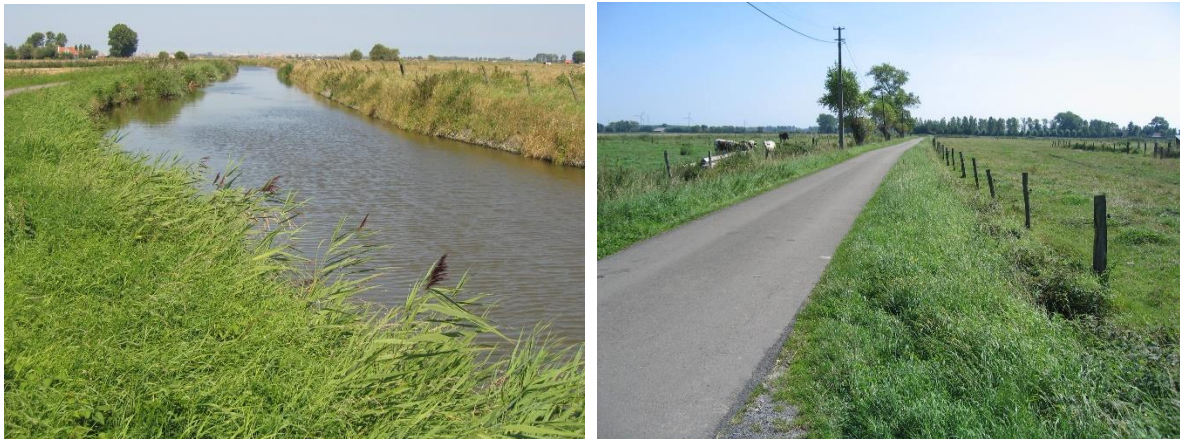
Afb. 5. De Blankenbergse Vaart en Blankenbergse Dijk, 2005

gebruikt voor het transport van goederen allerhande. De slechte toestand van de landwegen speelde hierin een voorname rol. Vanuit Zuienkerke kon men zo via de Grote Ede het sas te Speyen en langs de Leet Brugge bedienen. Zij verbond Brugge met de Noordzee en speelde voor de ontwikkeling van deze handelsstad dus een bijzonder belangrijke rol. De Grote Ede was tot 1724 erg belangrijk het goederentransport van en naar Brugge. Dat jaar werd de steenweg van Blankenberge naar Brugge in gebruik genomen. En ook daarna werd deze verbinding nog in stand gehouden. Ook voor Zuienkerke was de Grote Ede erg belangrijk. Het Sint-Janshospitaal te Brugge bezat een aantal pachthoven in het Brugse Vrije, onder meer Groot en Klein Schoeringe alsook Groot Hof Mariemont in Zuienkerke. De vaart verbond de landbouwwinningen met het Sint-Janshospitaal in Brugge en met de zee in Blankenberge. Het hospitaal gebruikte deze waterweg voor de aan- en afvoer van goederen en bouwmaterialen.