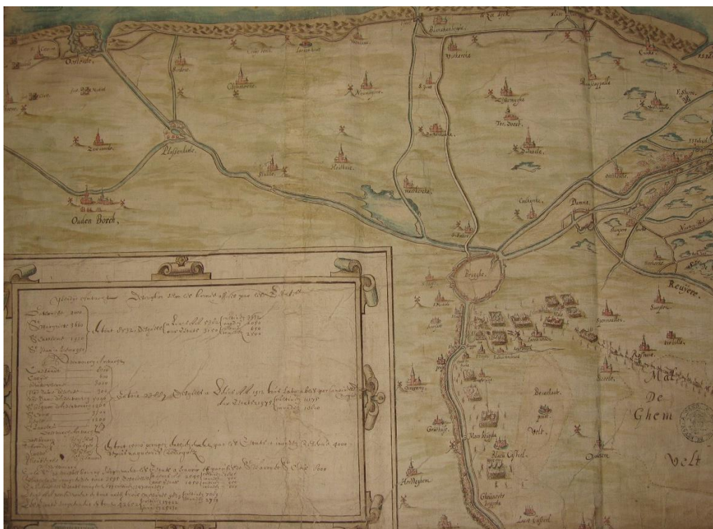
Afb. 3. kaart van De Gentele (begin van de 17de eeuw)

Een andere belangrijke kaart is "Environs d'Ostende, Bruges et Sas de Gand" uit het begin van de 17de eeuw. Hierop zijn twee voor Zuienkerke belangrijke landschapselementen waar te nemen, met name de Gentele of de Blankenbergse Dijk en de Grote Ede of de Blankenbergse vaart. Beide landschapselementen behoren tot het systeem van de Blankenbergse Watering. De oudste verwijzing naar de Blankenbergse Watering vinden wij terug in een Charter van 1337. Deze schrijft na de stormvloed, waarbij "Scarphout" nabij Blankenberghe door de zee verzwolgen werd, de bouw van de nieuwe dijken voor. Het oudst gekend reglement van de Watering is de "Keure van de Waetringhe van Blanckenberghe" geacteerd op 12 juni 1563. In die keure wordt de watering ook "Vincx Ambacht" genoemd. In de late 10 de en begin 11 de eeuw werd de regio door nieuwe overstromingen getroffen. Zij tastten het kustgebied aan via het vertakt krekensysteem langs de IJzer enerzijds en via de Sincfal tussen Knokke en het eiland Cadzand anderzijds.