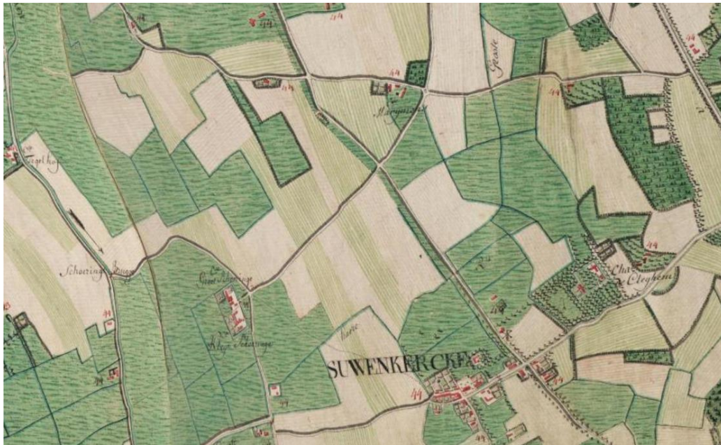
Afb. 7. Uittreksel uit de Ferrariskaart met aanduiding van Schoeringe, Groot Hof Mariemont en de Schoeringedreef