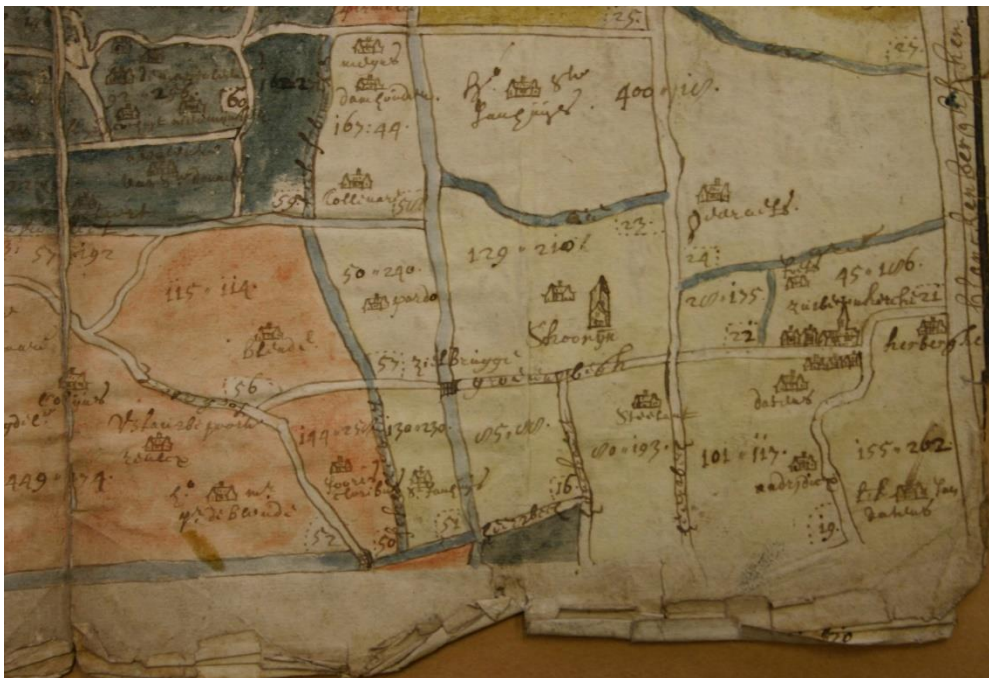
Afb. 4. Wateringue Blankenberghe

De afvoer van het overtollige water in deze regio gebeurde dus via de Blankenbergse Vaart, veruit de belangrijkste waterloop van deze regio. De oudste vermelding dateert van omstreeks 1185. Op dat ogenblik werd zij Vertinge genoemd, van de 14de tot het begin van de 17de eeuw vervolgens Grote Ede. Met de ontwikkeling van de stad Blankenberge werd haar naam tenslotte Blankenbergse Vaart. Deze waterloop was niet alleen belangrijk voor de afwatering van deze regio, maar werd ook druk