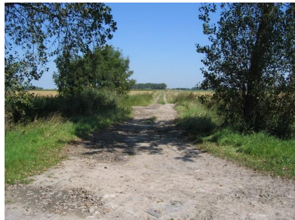
Afb.1. Groot Schoeringe en de Schoeringedreef, 2005.

Over de stichting van de hofstede Schoeringe in Zuienkerke is weinig bekend. Vermoedelijk vindt de hoeve haar oorsprong in een schenking van 1230 aan het Sint-Janshospitaal te Brugge. In een oorkonde van 1230 worden 33 mensuras 'ad opus hospitalis Sancti Johannis' vermeld. Tijdens de daaropvolgende jaren groeide het goed aan en werd het de belangrijkste boerderij van het Sint-Janshospitaal. Het Sint-Janshospitaal baatte aanvankelijke via inwonende broeders en zusters de hoeve zelf uit. Zij werden bijgestaan door personeel. In 1402 is er sprake van 39 knechten en meiden.