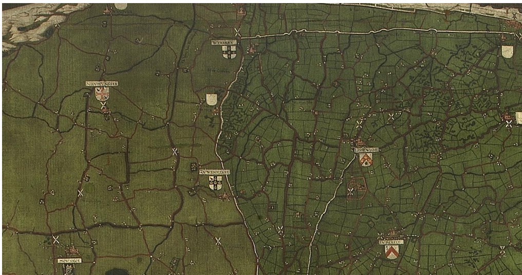
Afb.2. Grote Kaart van het Brugse Vrije door P. Pourbus uit 1562/1571, kopie door Pieter Claessens

Met betrekking tot de topografische ontwikkeling van het landschap rond Schoeringe, Groot Hof Mariemont en de weg tussen beide winningen horen tot de directe omgeving van de beschermde Uitkerkse polders ( Uitkerkse polder | Inventaris Onroerend Erfgoed ). is het niet steeds even eenvoudig de bijzondere landschapselementen te herkennen en in een historisch perspectief te plaatsen. Het landschap van de kuststreek evolueerde immers voortdurend. Gelukkig kunnen wij voor Zuienkerke en specifiek voor Schoeringe beroep doen op een hele reeks kaarten van zeer verscheiden aard om de relevante bijzondere landschapselementen te duiden. Zij tonen aan dat de belangrijkste landschapselementen vrij goed tot uitstekend bewaard bleven. Maar geregeld zijn zij licht aangepast of ook in onbruik geraakt en zo vervallen.